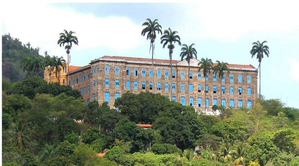
Mosteiro dos Jesuítas localizado no Município de Baturité