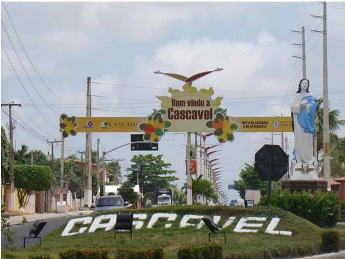
ENTRADA DA CIDADE