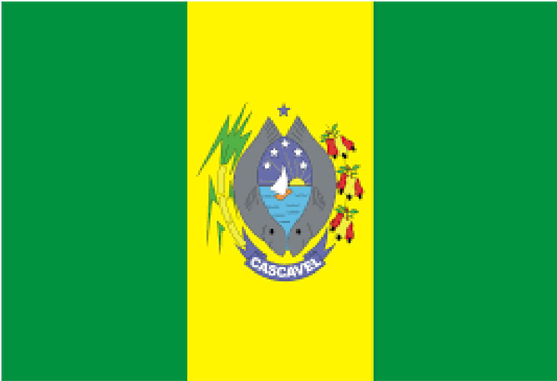
BANDEIRA DO MUNICIPIO